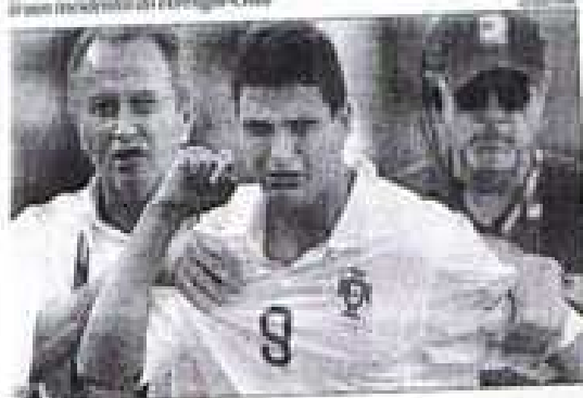
Atletas portugueses de Futebol já prometem punições incidentes do Portugal-Chile

A indisciplina dos jogadores portugueses de Futebol já promete punições incidentes do Portugal-Chile. Os jogadores portugueses de Futebol já prometem punições incidentes do Portugal-Chile.